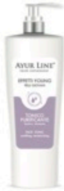
FASE 2 tonico purificante