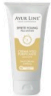
FASE 6 crema purificante