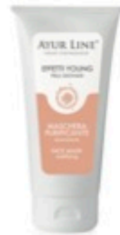
FASE 5 maschera purificante