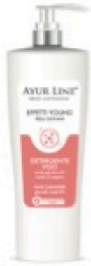
FASE 1 detergente viso